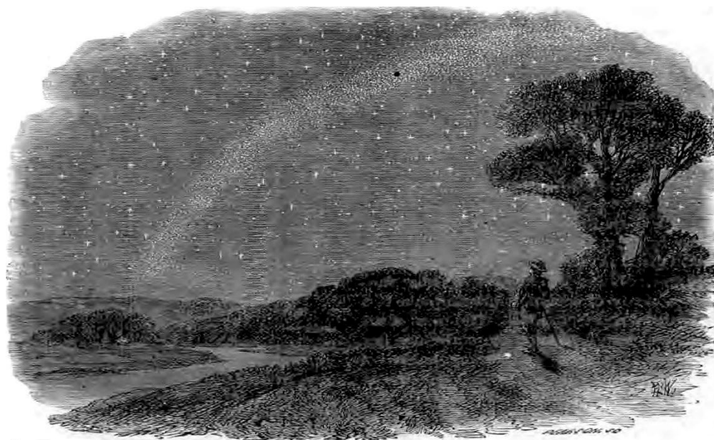
„ON IZVODI NJIHOVU VOJSKU NA BROJ.“

dara, iako su sva ona neprestano u pokretu? „Gravitacija,“ kažu nam. Na primer, uzmimo naš sunčev sistem. Ljudi izostavljaju Boga iz diskusije, i govore kao da je uložena sila bila svojstvena samim nebeskim telima. Sunce, kažu oni drži planete u njihovim orbitama. Vrlo dobro, mi znamo to pošto su Božja večna sila i Božanstvo viđeni u svemu što je on napravio, postoji sila u suncu i svim drugim telima; ali hajde da razmišljamo dovoljno dugo da se uverimo da je to samo Božja sila. Pogledajte zemlju kako se okreće oko sunca. Sada ona leti sa čudesnom brzinom direktno dalje od sunca. Privlačenje drugih planeta je privlači, kažu nam. Vrlo dobro, zašto ona onda ne nastavi dalje? Zašto stane na svom letu, i okrene se nazad prema suncu? „Oh, sunce je privlači!“ Da, ali